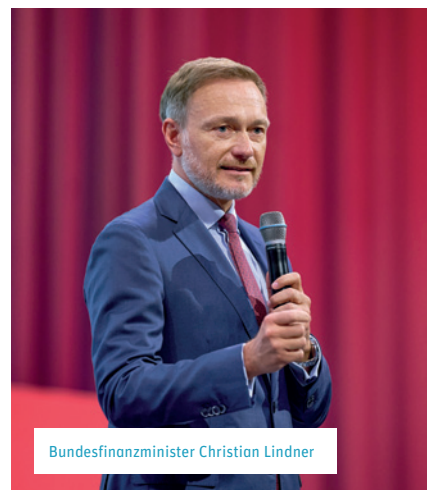
Bundesfinanzminister Christian Lindner