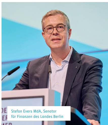
Stefan Evers MdA, Senator für Finanzen des Landes Berlin